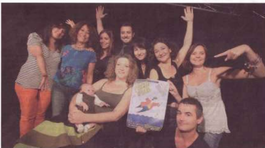
La deuxième édition s'est préparée avec toute l'équipe de l'Espace Bonsaï.

2 e édition du Piccolo festival aujourd'hui, demain et dimanche, salle du 8-Mai et espace Bonsaï Huit spectacles proposés par les troupes de la région et des jeunes des écoles de théâtre