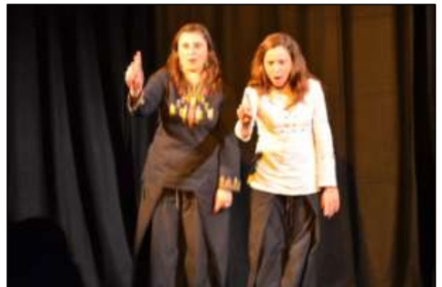
"La clé sous le paillason"