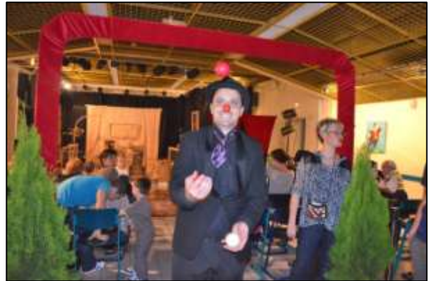
Le célèbre Alain Di Maggio !