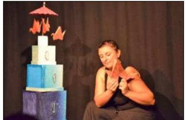
"Le même pas vrai voyage de Philopède"