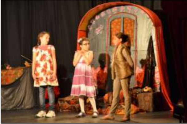
Les Piccoli Artistes