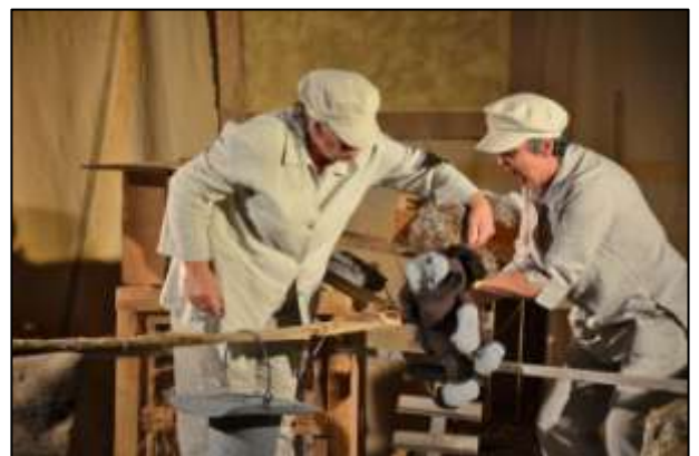
"Sans plume et 100 questions"