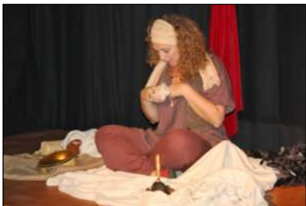
"Contes du bout des doigts"