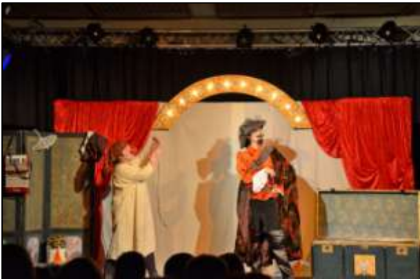
"C'est bô la vie"