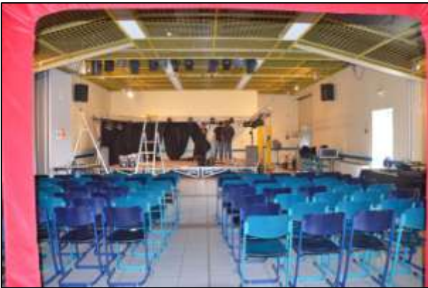
Installation de la scène et de la salle du Huit Mai