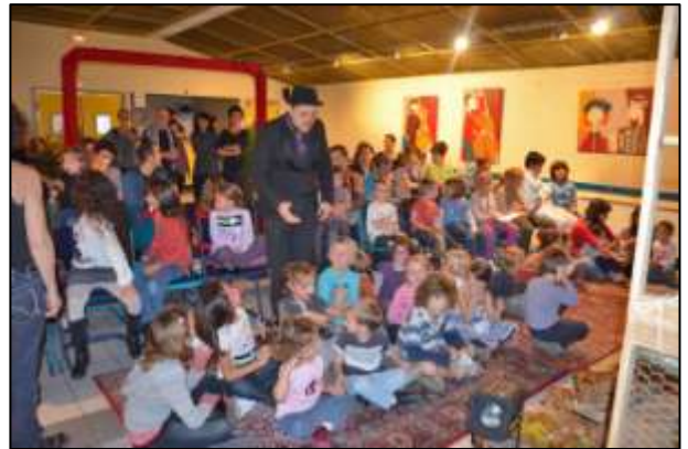
Installation du public