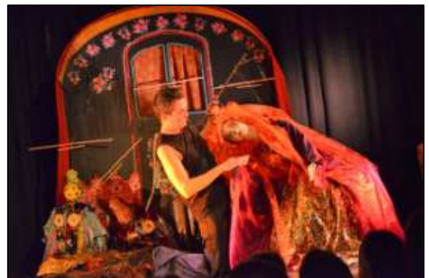
"La Baraka couleurs"