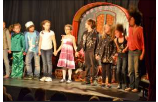
Les Piccoli Artistes