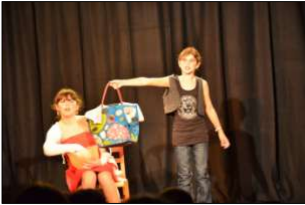
Les Piccoli Artistes