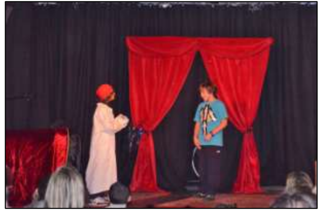
Les Piccoli Artistes