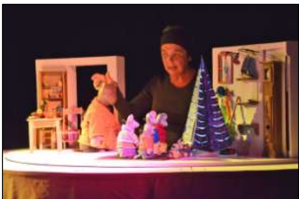
"Ernest et Célestine ont perdu Siméon"