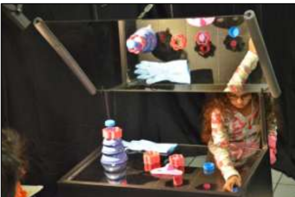
La Machine miroir