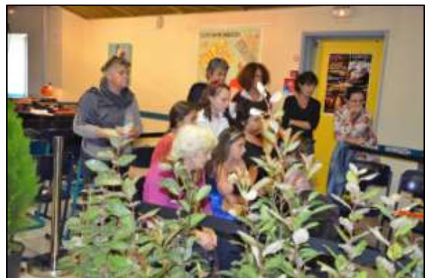
Démonstration en public